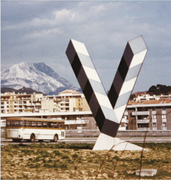
Photographie - 1975

V ictor Vasarely est né à Pécs, en Hongrie en 1906. Après des études de médecine, il se consacre à la peinture et entre, en 1927, à l'Académie Poldini-Volkman. Après un passage au «Muhëly», le Bauhaus de Budapest, il s'installe à Paris en 1930 et conçoit alors une oeuvre graphique importante ; il en tire sa propre «sémantique plastique».